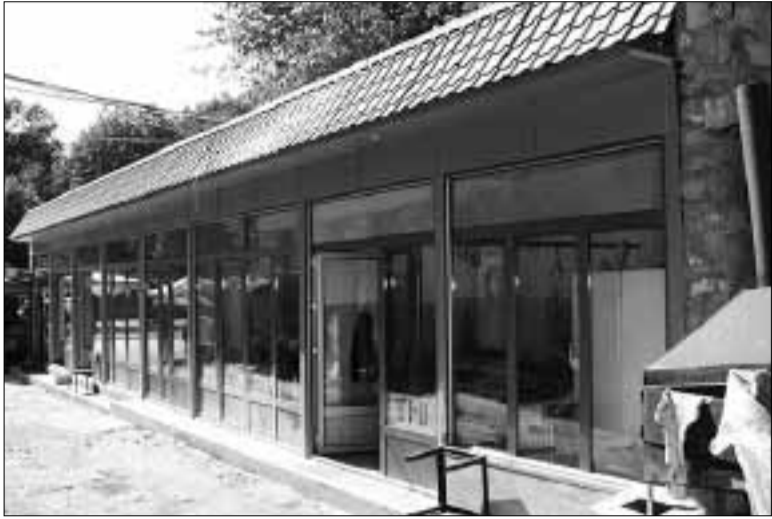
Մարզկենտրոնի հանրությունը շարունակում է հետելու Կապանի Զ.Ավետիսյան փողոցի N1 Ա շենքի եւ քաղաքային շուկայի միջանկյալ հարվածում ապօրինաբար կառուցված քաղաքային շուրջ զարգացումներին:

Ինչպես տեղեկացրել ենք «Սյունյաց երկիր» 2012թ. նոյեմբերի 14-ի համարում տպագրված հոդվածում («Մի քրեական գործի մասին, որի քաղաքական ենթատեքստն առայժմ չի բացահայտվում»), 2012թ. ապրիլ-մայիս ամիսներին Կապանի բնակիչներ Արթուր Առաքելյանը, Գարիկ Սահակյանը, Գարիկ Գրիգորյանը, Սամվել Գրիգորյանը, Քնարիկ Գրիգորյանը, Սպարտակ Գրիգորյանը, Արտուր Առաքելյանը, Սամվել Գրիգորյանը, Քնարիկ Գրիգորյանը, Սամվել Գրիգորյանը և Քնարիկ Գրիգորյանը որոշմամբ սահմանված կարգով պարտավոր էր կասեցնել այդ կառույցի իրականացումը, բայց չի կասեցրել (պատճառներն ու հանգամանքները, ինչպես են մեր գիրքորոշումը շարադրել ենք վերջը նշված հոդվածում): Օրենքով իր վրա դրված պարտականությունը չկատարելու համար նրա հանդեպ