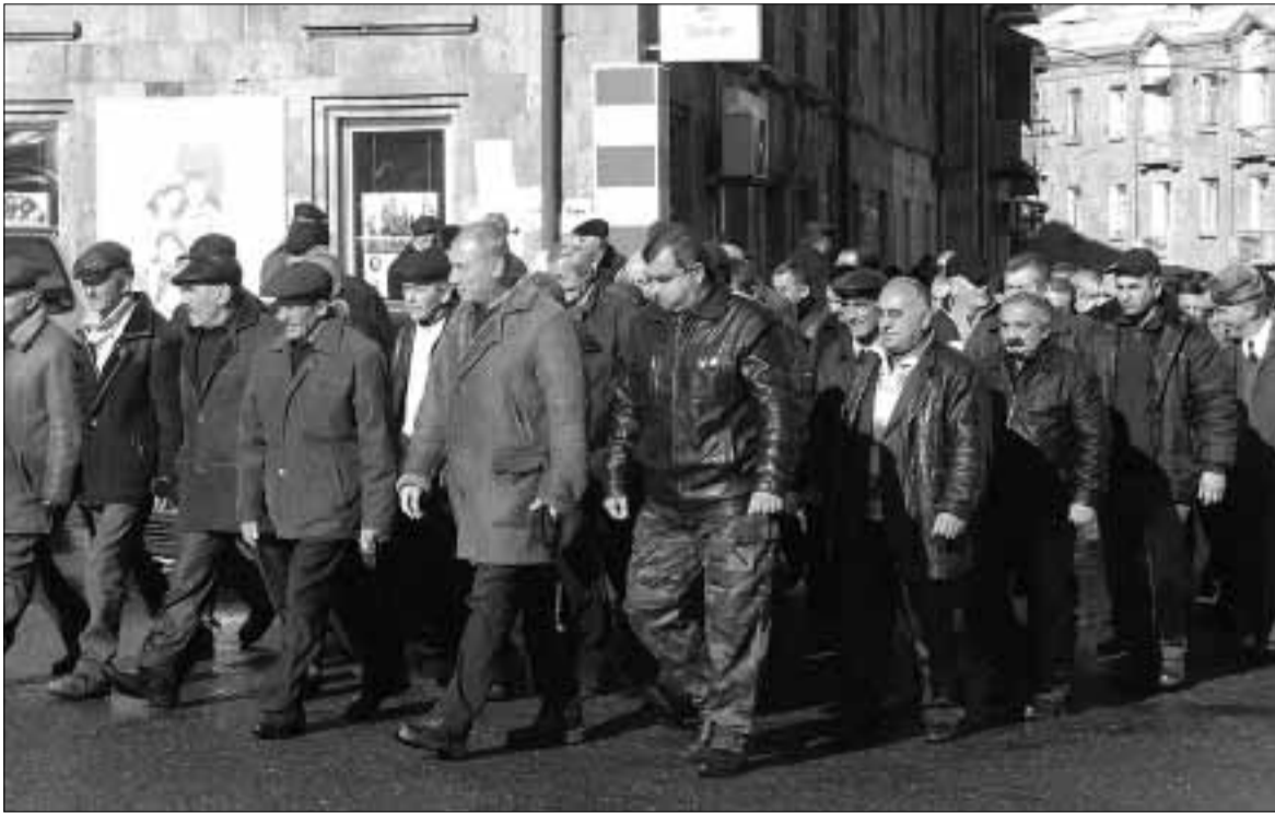
Նախկին մարտական ընկերներն անցնում են Նժդեհի հրապարակով